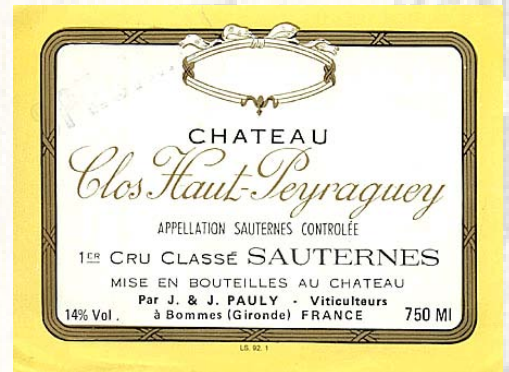
CHATEAU CLOS HAUT PEYRAGUEY