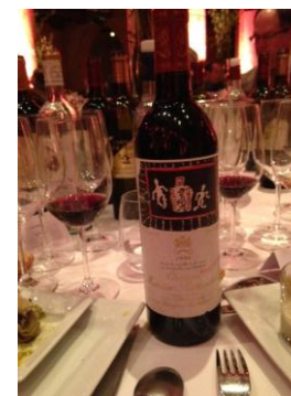
Ch. Siran 1953